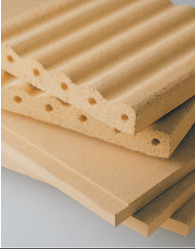
Elemente des L+F-Schamotte-Speicherheizsystems.